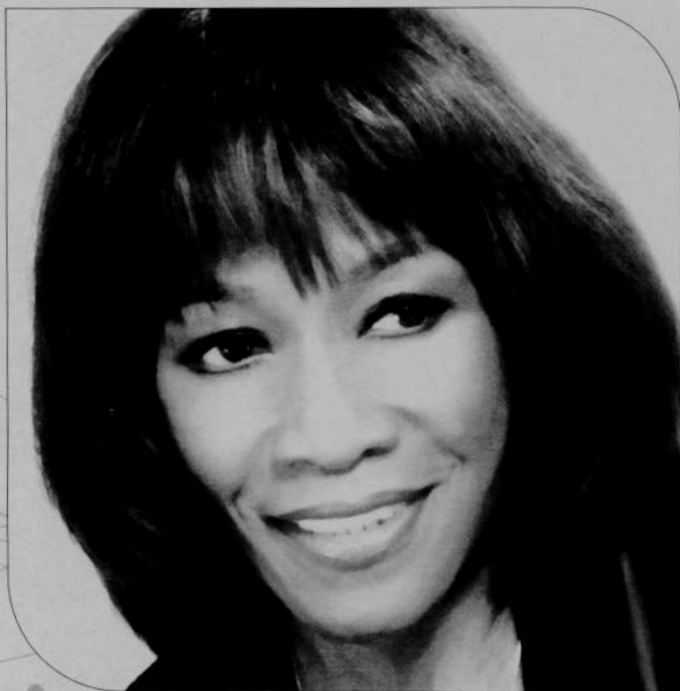
SALENA JONES (vo) romantic, heartwarming, soulful... infinitely versatile サリナ・ジョーンズ

Salena Jonesは1944年1月29日にアメリカ・ヴァージニア州の東海岸にある小さな港町ニューポートニュースで生まれた。インディアンのスー族、Crazy Horseの直系の子孫であり、音楽演奏家の母と叔父を持つSalenaは、幼い頃から家や、教会、学校の作品の中や、また十代の前半でありながら、小さなクラブでも歌いはじめた。ニューヨークに移ってからすぐに、Salenaはクラブ出演し広く認められると共に注目を集めた。驚くべきことは、彼女がたった15歳までの間に15枚のシングル(レコード)を製作したことである。